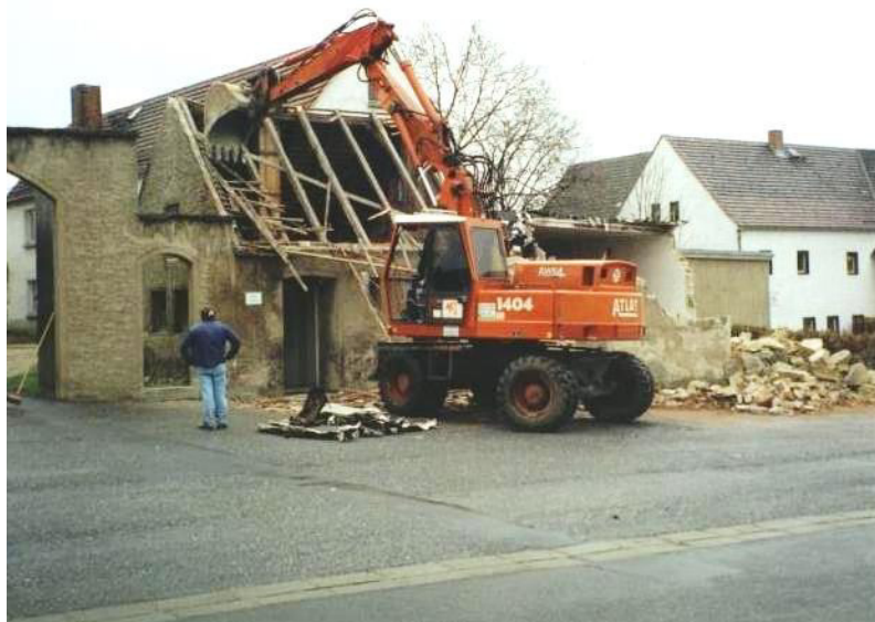
Wottorhanje stareje gratownje wohnjoweje wobory, nětko sanitarne připrawy putniskeje cyrkwyje