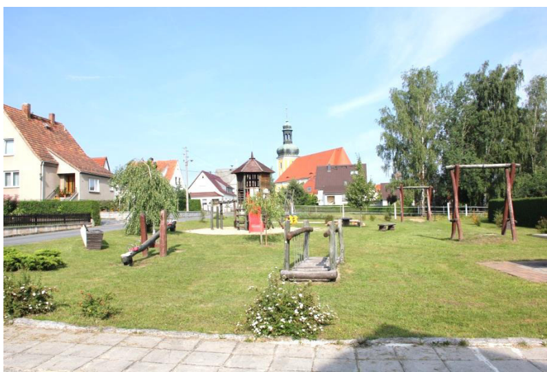
Nowe hrajkanišćo w Róžeńce