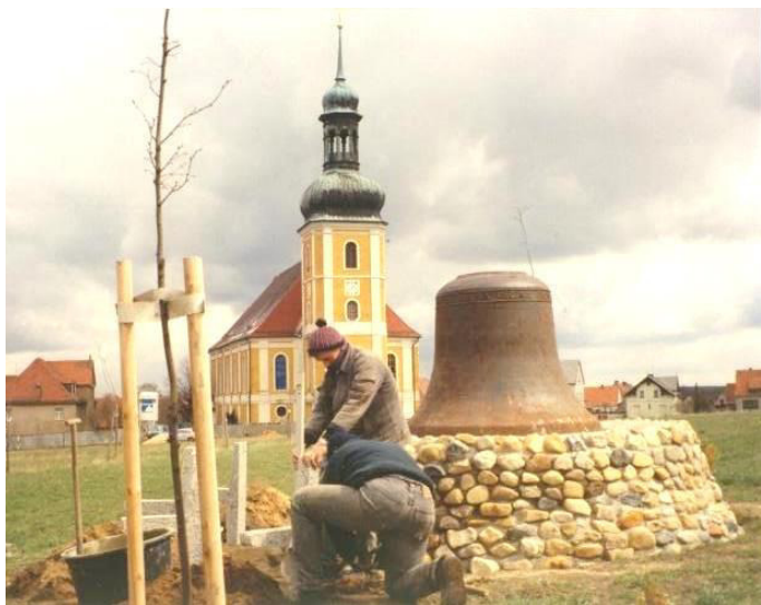
Wuhotowanje areala při putniskej luce w ramiku projekta Ralbičanskeje šule

Dale je gmejna leżownosć kupiła, zo by so hrajkanišćo twarić móhło. Saněrowany buchu džěl Sydlišćoweho puća, Romualda Domaškowa dróha kaž tež Jurja Wowčerjowa dróha, kotraž dósta hišće nowe nadržne wobswětlenje. Tež parkowanišćo před cyrkwu bu wuhotowane a nowe natwarjene, runje tak bu nawjes z hatom saněrowana a dósta nowe nadržne wobswětlenje.