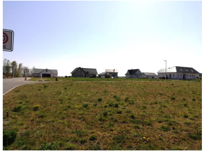
Prěnje domy w nowej bydlenkej štwórci Różeńčanska dróha

Dale kupi gmejna dwaj hektaraj wulku płoninu a planowaše ju jako twarsku płoninu wužiwać. Tak bu bydlenka štwórc Różeńčanska dróha ze 16 domami z nadržnym wotwódnjenjom, milinu, zemskim płonom, dróhu a nadržnym wobswětlenjom přistupjene. Mjeztym su přenje chěže twarjene a wobydlene, dalše so runje twarja.