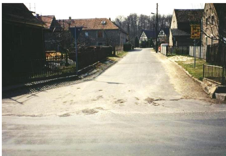
Dróha Ke kowarni