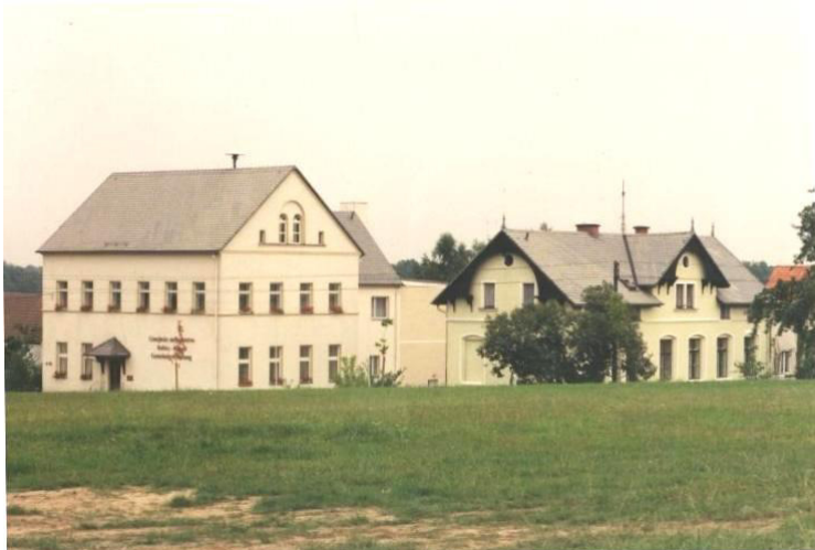
Wobnowjony kompleks twarjenjow gmejskeho zarjada

W Róžeńće, džensnišim sydle gmejny, bu kompleks twarjenjow gmejskeho zarjada z přislušnymi pódlanskimi twarjenjami kompletnje saněrowany. K tomu slušachu třěchi, fasady, tepjenje, sanitarne připrawy, wokna a nutřkowny wutwar. Nimo toho bu młodžinski klub zarjadowany a wjesna rada kaž tež wjesne towarstwa dóstachu swójske rumnosće.