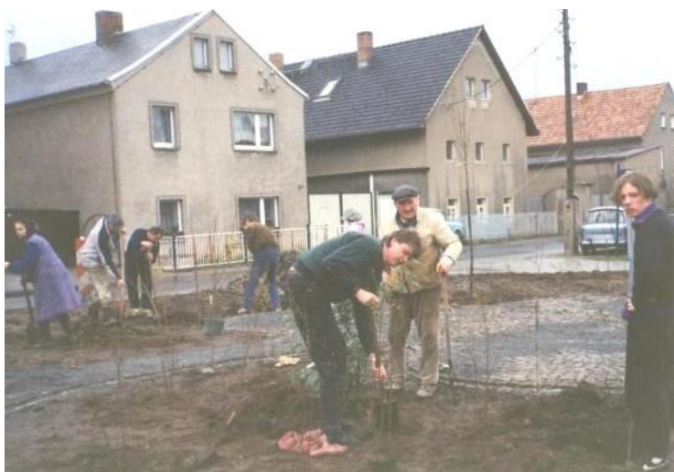
Sadženje kerkow na nowo wuhotowanej nawsy

Tež w Sernjanach bu nawjes wutwarjena a dósta nowe nadržne wobswětlenje. Nimo toho bu puć Ke kowarni wutwarjena a dósta nowe nadržne wobswětlenje a nadržne wotwódnjenje. Saněrowany bu džěl dróhi Při rězaku z wotstajenišćom za kontejnery. Nimo toho bu hrajkanišćo twarjene a dróha a leżownosće bydlenskeje štwórcy Při hórce buchu z nadržnym wotwódnjenjom a nadržnym wobswětlenjom přistupjene.