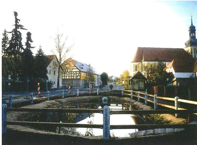
Nawjes z hatom po ponowjenju