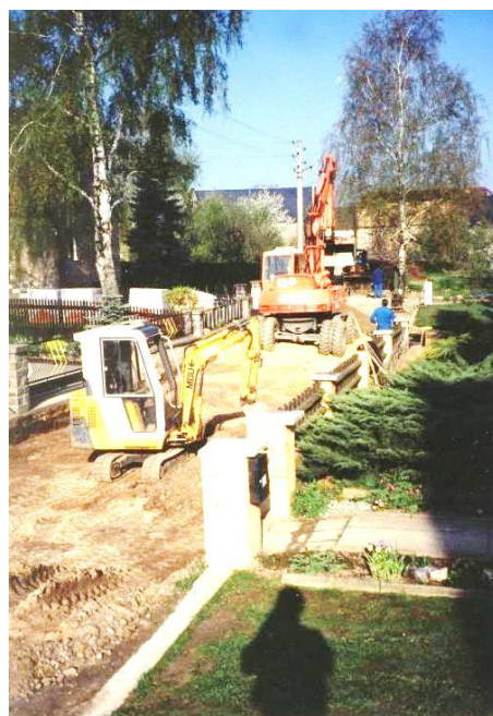
Wutwar Jurja Wowčerjoweje dróhi