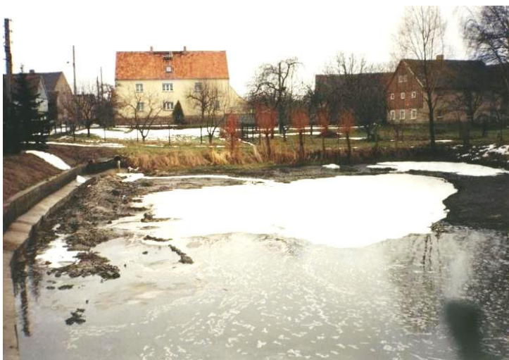
Wjesny hat w Hrańcy

Swobodny kraj Sakska přewza zakładny wutwar statneje S 101 wot Nowoslic do Chrósćic, kotraž wjedže tež nimo Hrańcy.