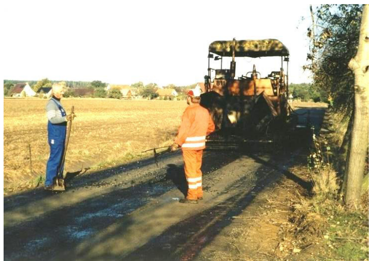
Ponowjenje dróhi mjez Hrańcu a Hórkami