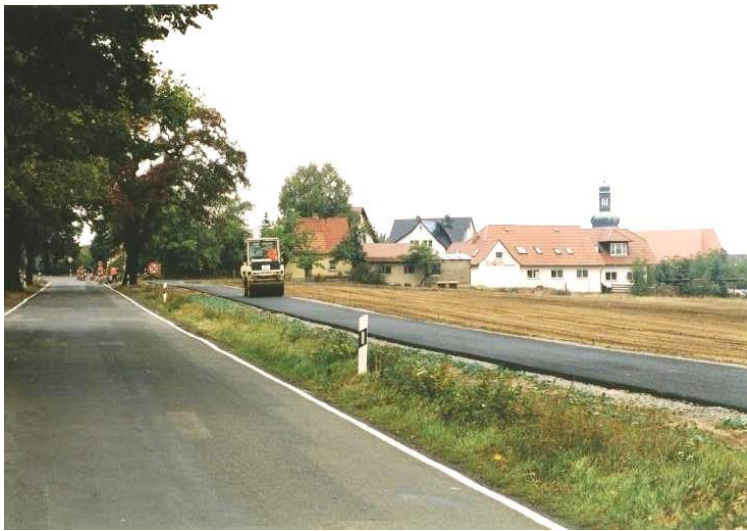
Twar kolesowarskeje šćežki mjez Różantom a Sernjanami